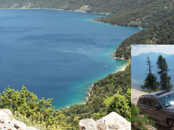
Bild: Kroatien/ Insel Cres