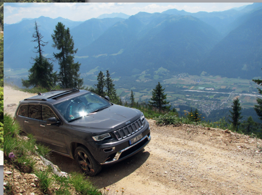
Bild: Österreich, Blick ins Gailtal